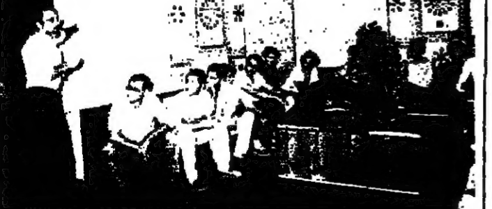
من اجتماع السائقين